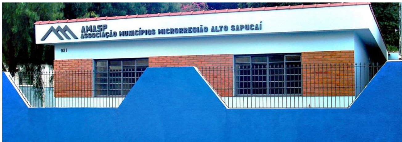
Convênio com AMASP dará mais eficiência em alguns serviços da Prefeitura.

Secretário Municipal de Fazenda fazenda@delfimmoreira.mg.gov.br